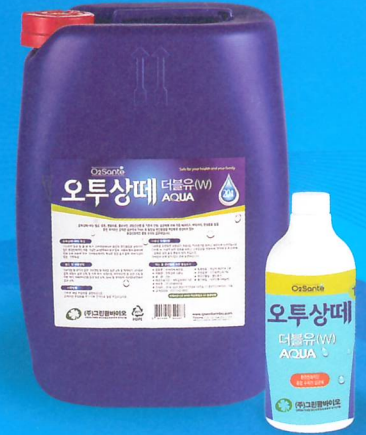
오투상떼-더블유 20L, 1L