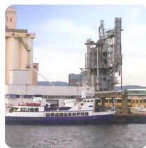
각종 산업장의 악취 제거